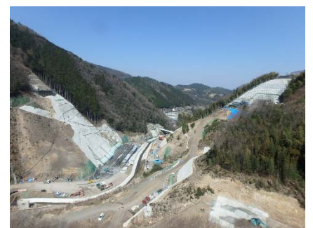
上流よりダム下流を望む